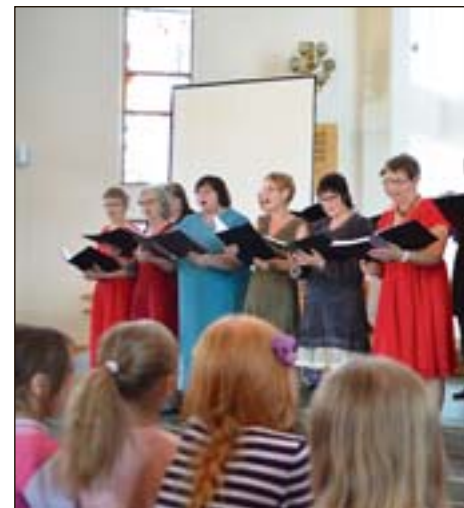
Arrangøren Salig Blanding, leverte en