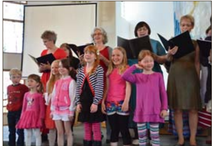
Barnekoret får øye på bamsefar.