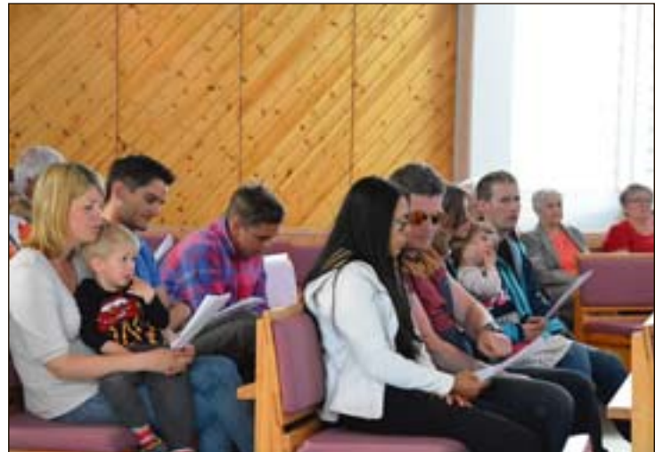
Familiekonserten hadde også allsang på programmet.