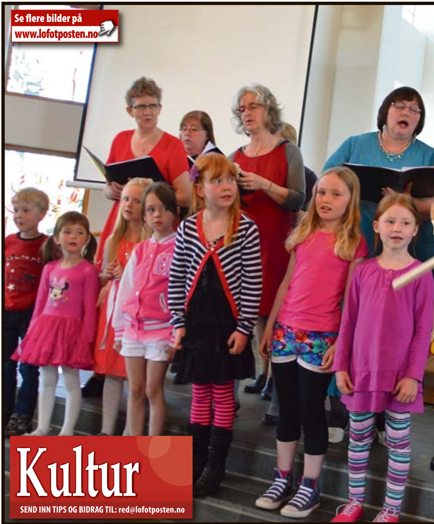
Bamsefar var selvfølgelig på plass da Salig Blanding og barnekoret sang i Bamsens fødselsdag på familiekonserten i Borge kirke.