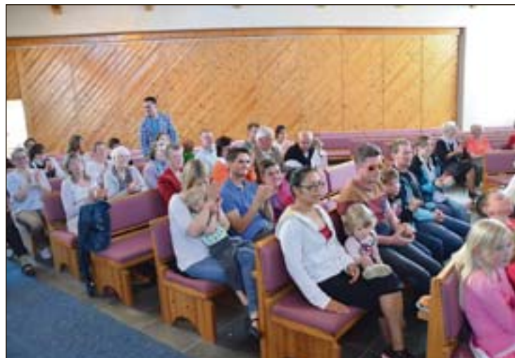
63 betalende publikum var på konserten. Barn under 12 år slapp gratis inn.